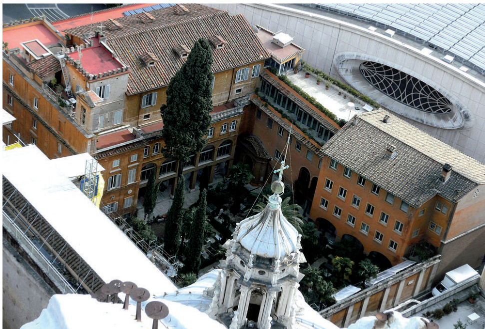
Collegio Teutonico vanaf de koepel van de St.Pieter